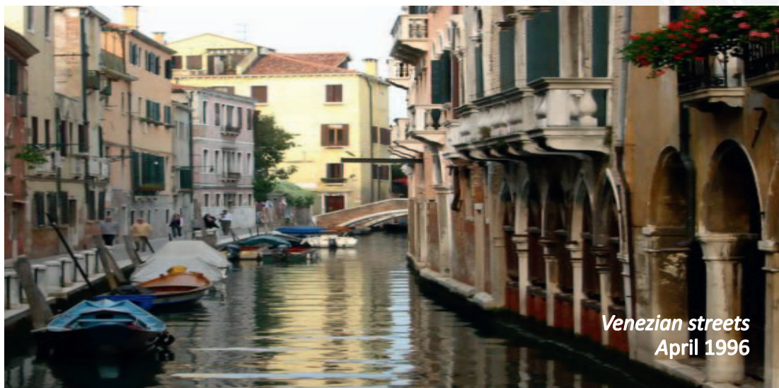
Venezian streets April 1996

Nekaj malega smo še 'kantâli', pospravili