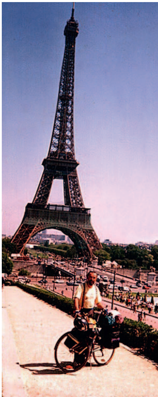
Prišel sem tudi v Pariz! Maj 1996

Pozno zvečer sva se poslovila z obljubo,