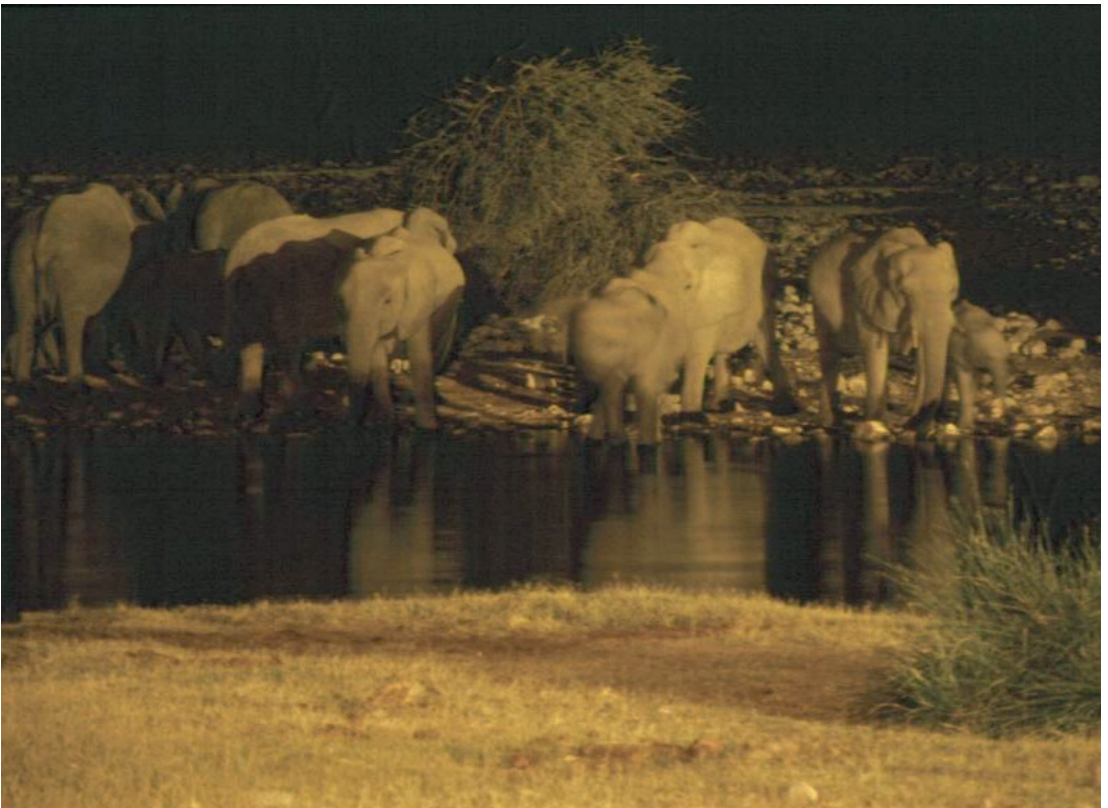
Skupina slonic skrbno varuje svoje malčke. Dobrodušne živali so lahko v času materinstva izredno napadalne...